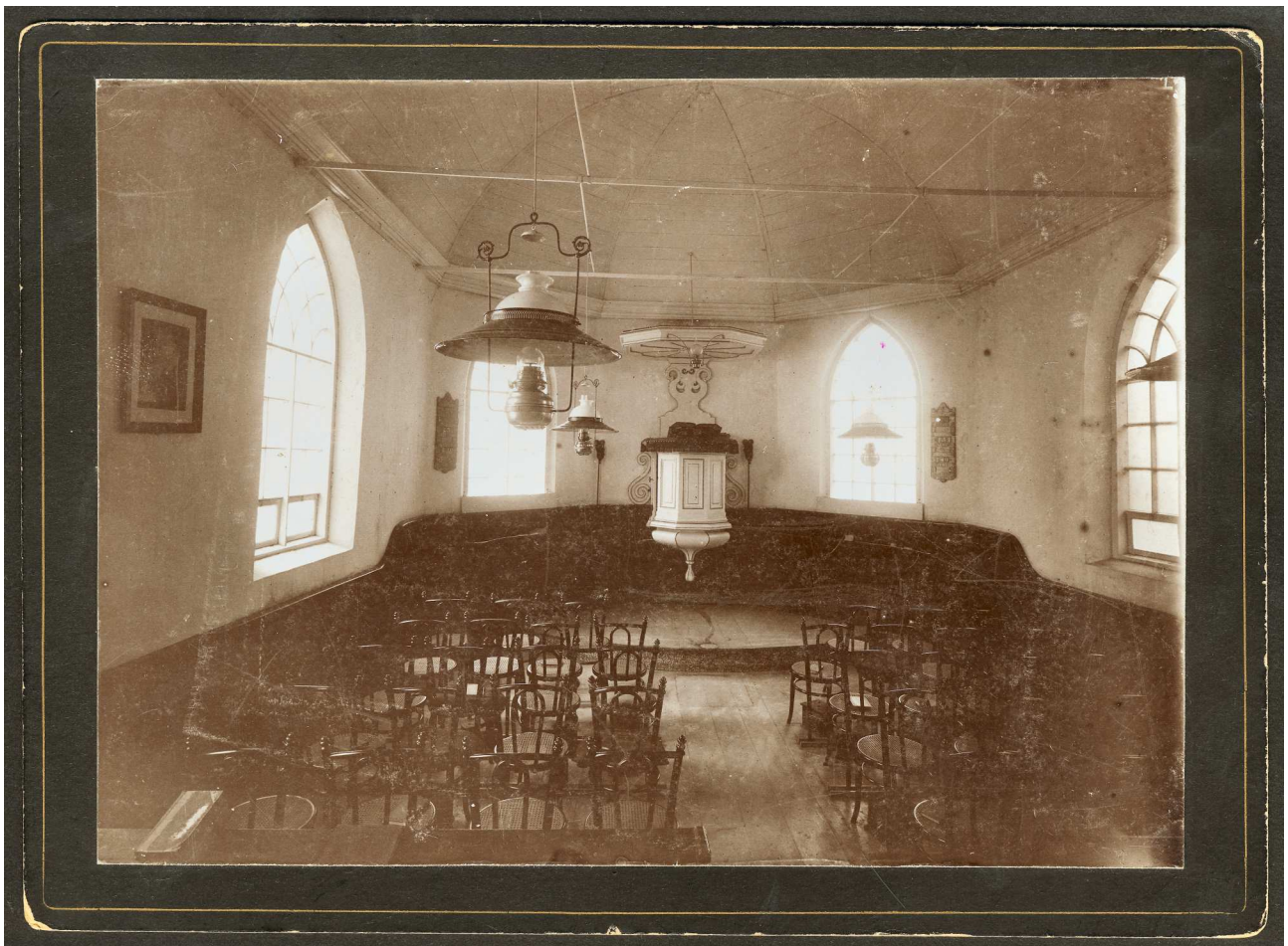
In deze uitgave van de eerder in de dorpskrant De Driuwplølle gepubliceerde verhalen kunnen we u nu ook een interieurfoto van de kerk laten zien . Deze foto uit het begin van de vorige eeuw bevindt zich in de collectie Doopsgezinde prenten in de Universiteitsbibliotheek van Amsterdam (UvA), Bijzondere Collecties.

aankleding van de kerk. Een orgel ontbrak, maar in 1870 kon voor een bedrag van f. 746,77½ een harmonium orgel geplaatst worden.