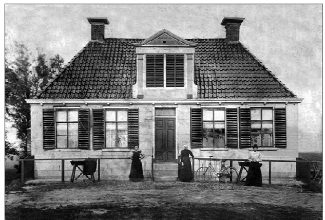
Een foto van "Station Woudsend" omstreeks 1900 (wie de dames zijn is niet bekend).