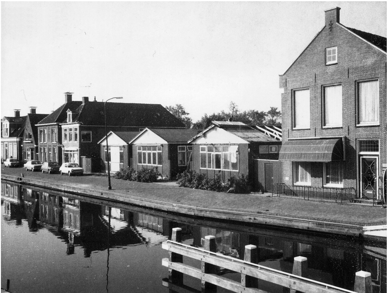
De lewâl rond 1970, met de tijdelijke barakken.

Ook raakte Woudsend Verzekeringen in dit jaar haar eigen naam kwijt; een teken aan de wand. Het kantoor heette nu officieel Fortis ASR. In 2006 werd nog wel door de directie bevestigd dat de vestiging in Woudsend open zou blijven en wel als Klant Contact Center. Maar mee door de kredietcrisis raakte Fortis in de problemen en werd er besloten om onderdelen te verkopen en vestigingen te concentreren. Dit had grote gevolgen voor Woudsend. In juli 2009 kwam het schokkende nieuws dat uiterlijk december 2012 het Woudsender kantoor definitief zou gaan sluiten. Een lobby van personeel, vakbonden, gemeente, Provinciale Staten en leden van Tweede Kamer had helaas geen succes. Op 1 oktober 2012 viel definitief het doek.