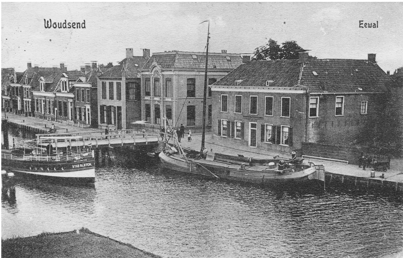
De lewâl rond 1900, nog met de historische panden.

Rotterdam. En niet zonder succes. Door een aantal ingrepen, waaronder sanering, droeg Woudsend al in 1971 bij aan de winst. Het kantoor verloor hierbij wel haar zelfstandigheid maar kon verder als zelfstandige vestiging blijven bestaan. Stad Rotterdam zag ook de potentie van hun nieuwe aanwas. De verzekerings-activiteiten werden uitgebreid en de huisdrukkerij en het magazijn van het gehele concern kwamen naar Woudsend. Het ging zo voor de wind dat de al in 1969 geplande nieuwbouw eindelijk realiteit kon worden.